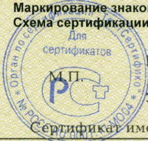
Схема сертификации 3.

Маркирование знаком соответствия по ГОСТ Р 50460-92.